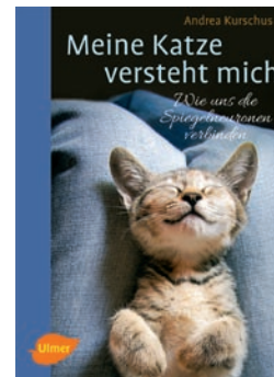
Meine Katze versteht mich

Den Hintergrund bilden dabei die Spiegelneuronensysteme im Gehirn. Auf der Basis unterschiedlicher Emotionen und Gemütsbereiche der Katzen werden ihre Wirkweise erklärt und ihre Wichtigkeit für das Lernen, Empathie und artübergreifendes Verständnis dargestellt. Neben dem Fließtext enthalten extra Info-Kästen wichtige Merksätze und warten mit Anekdoten auf. So ist dieses Buch etwas für jeden, der eine unterhaltsame und gleichzeitig informative Lektüre möchte, um sein Tier noch besser zu verstehen.