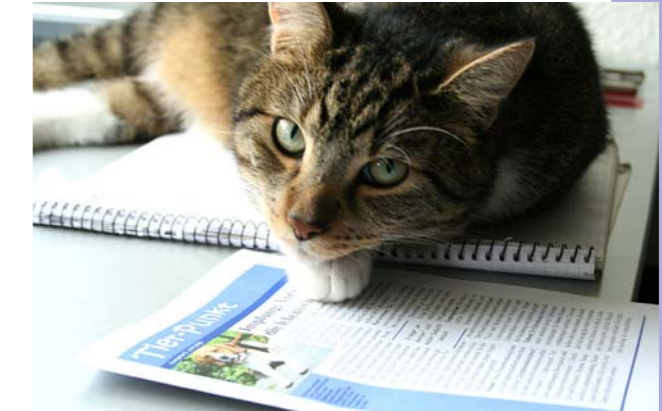
Kater Elvis ist noch häuslicher geworden.

Da ich bei einem größeren Ausflug von unserem unliebsamen Nachbarskater „vermöbelt“ worden bin und mich der Tierarzt erst einmal krank schreiben musste, war ich in meinem geliebten Garten einige Zeit nicht einsatzfähig.