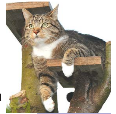
Kater Elvis ist ein Genießer . . .

Ab und zu möchte ich auch mal etwas Frisches im Napf. Also, ich meine, nicht immer dieses Dosenfutter – ist ja alles sehr gehaltvoll und schmackhaft. Dennoch: Gegen ein schönes zart gekochtes Hähnchen-Geschnetzeltes habe ich nichts einzuwenden. Ganz im Gegenteil: Das gehört unbedingt auf den Speiseplan!