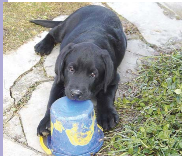
Ein Welpen sollte nur aus einer seriösen Zucht stammen - wie Labrador Clinton, der gesund und sozial gut geprägt ist.

Jetzt im Frühling boomt wieder das Geschäft mit Hundewelpen aus unseriösen deutschen und osteuropäischen Massenzüchtungen. Viele Tiere stammen aus Osteuropa und werden nach oft tagelangen Transporten in Deutschland verkauft. Häufig werden sie über Kleinanzeigen oder im Internet angeboten.