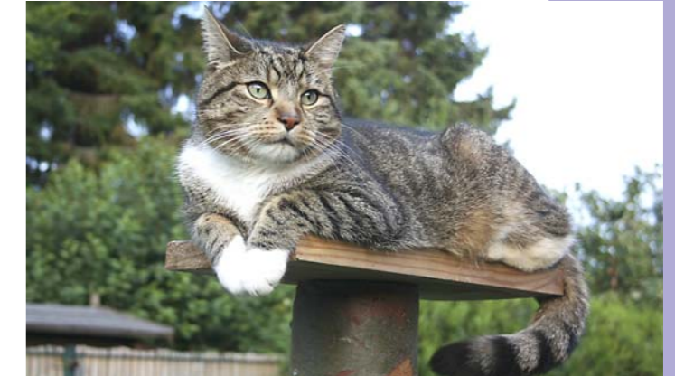
Kater Elvis vermisst die Mäuse.

Es ist wie verhext: seit Tagen habe ich keine einzige Maus gefangen! Okay, mein Revier beschränkt sich zwar nur auf unseren Garten, aber in den vergangenen Monaten hat sich regelmäßig ein kleines dummes Nagetier im Garten verirrt. Doch jetzt ist kein einziges weit und breit zu sehen! Sollten die winzigen Gesellen dazu gelernt haben? Sind sie intelligenter geworden oder haben sie sich gar abgesprochen? Ich weiß es nicht.