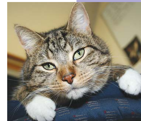
Kater Elvis ist ungern der Verlierer.